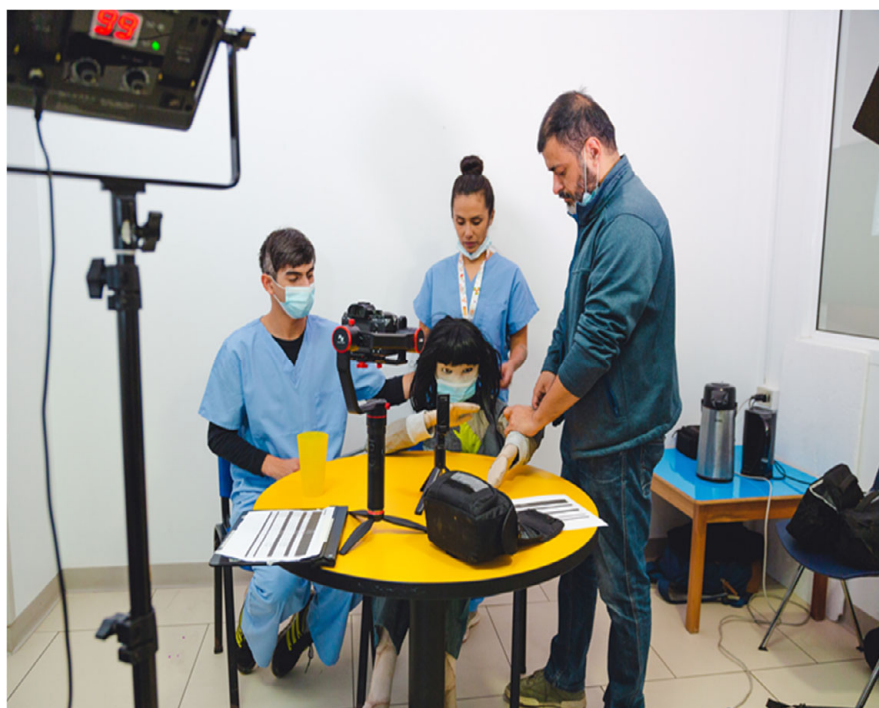
FIGURA 3. Proceso de grabación del cortometraje Janis , en las dependencias de la UHCIP del H. Dr. Exequiel González Cortés

marioneta protagonista de la pieza audiovisual la paleta de colores, vestuario, entre otros elementos. Se demuestra así, que el arte en sus diversas manifestaciones es un punto de conexión emotiva y creativa con adolescentes con desafíos de salud mental, quienes logran no solo expresar sus dolencias mediante las artes, sino también una vía para auto conocerse a sí mismos, mejorando su nivel de autoestima y percepción de la realidad, sintiéndose valiosos y validados por los demás, relevando la sana convivencia con otros y otras al crear colaborativamente.