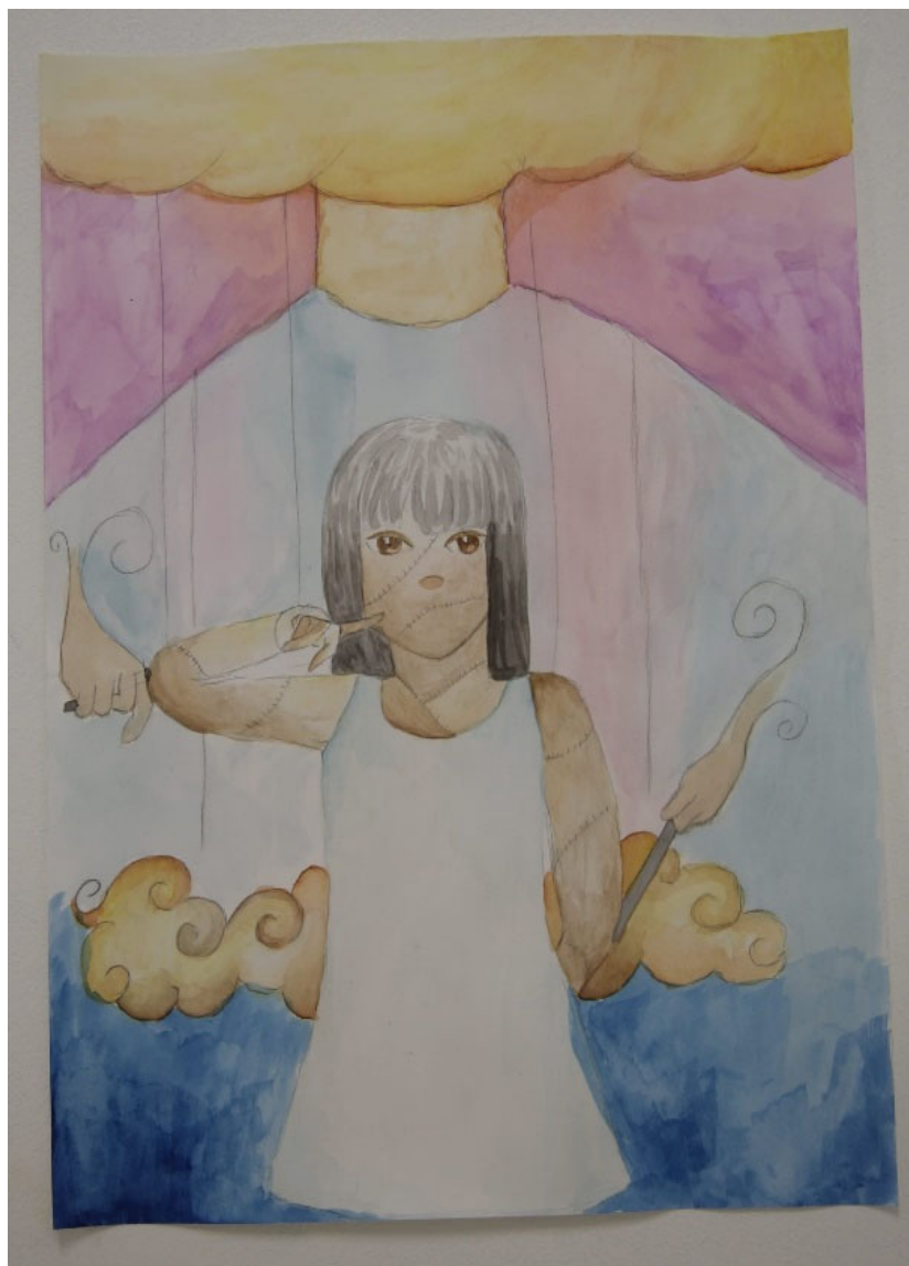
FIGURA 2. Bocetos del personaje protagonista del cortometraje Janis. Realizado en el proceso de creativo, por una adolescente de la UHCIP.