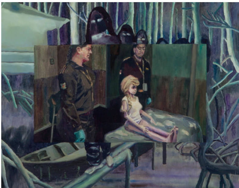
NUEVAS SUSTANCIAS II 2020 Óleo sobre papel 55 x 75 cm Propiedad de la artista