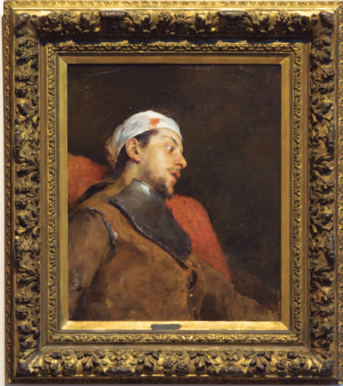
Luca Bizzoni, 2018 The Last Days of Pompeii Oil on canvas 100 x 100 cm