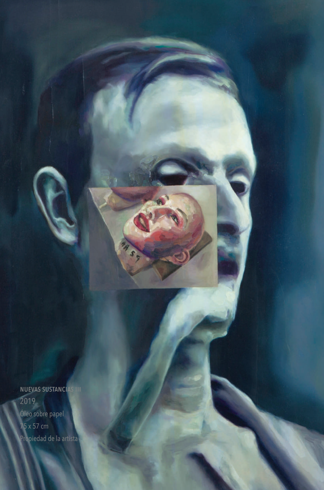
NUEVAS SUSTANCIAS III 2019 Óleo sobre papel 75 x 57 cm Propiedad de la artista