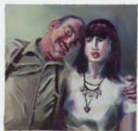
NUEVAS SUSTANCIAS VIII 2020 Óleo sobre papel 31 x 41 cm Propiedad de la artista