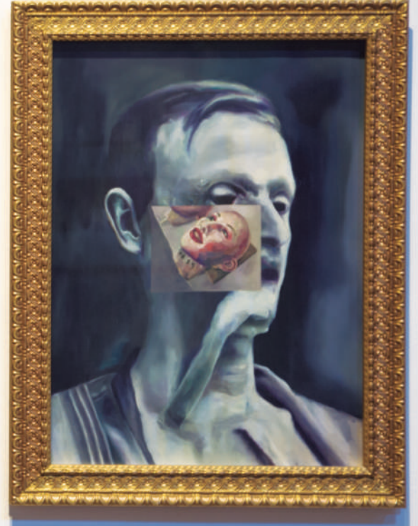
Marco Ruffini, 2019 The Last Days of Pompeii Oil on canvas 100 x 100 cm