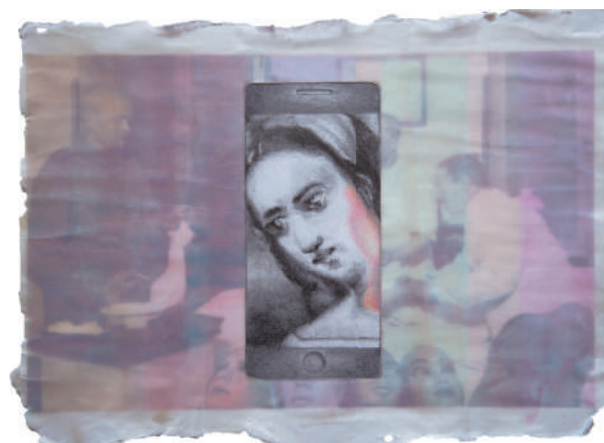
SERIE GABINETE DE LA PIEL 2020 Grafito, lápiz y piel acrílica sobre papel 21 x 30 cm Propiedad de la artista