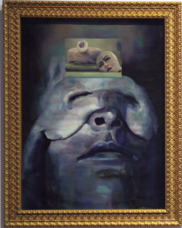
Marco Ruffini, 2019 The Last Days of Pompeii Oil on canvas 100 x 100 cm