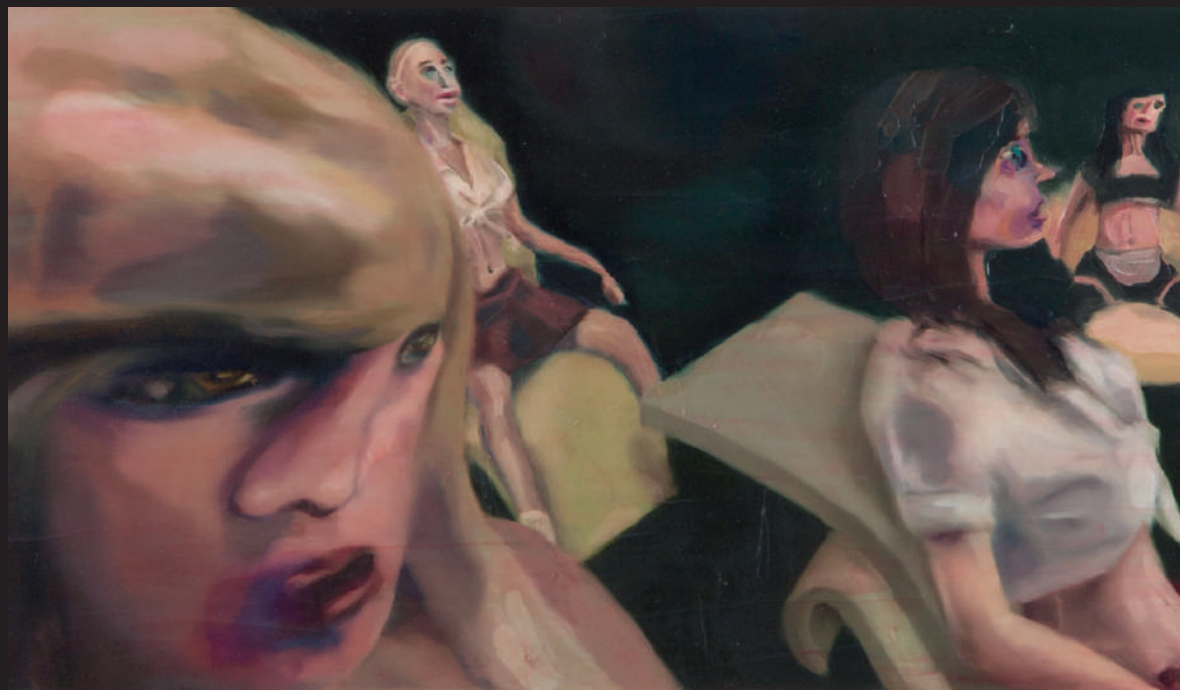
NUEVAS SUSTANCIAS I 2019 Óleo sobre papel 75 x 57 cm Propiedad de la artista