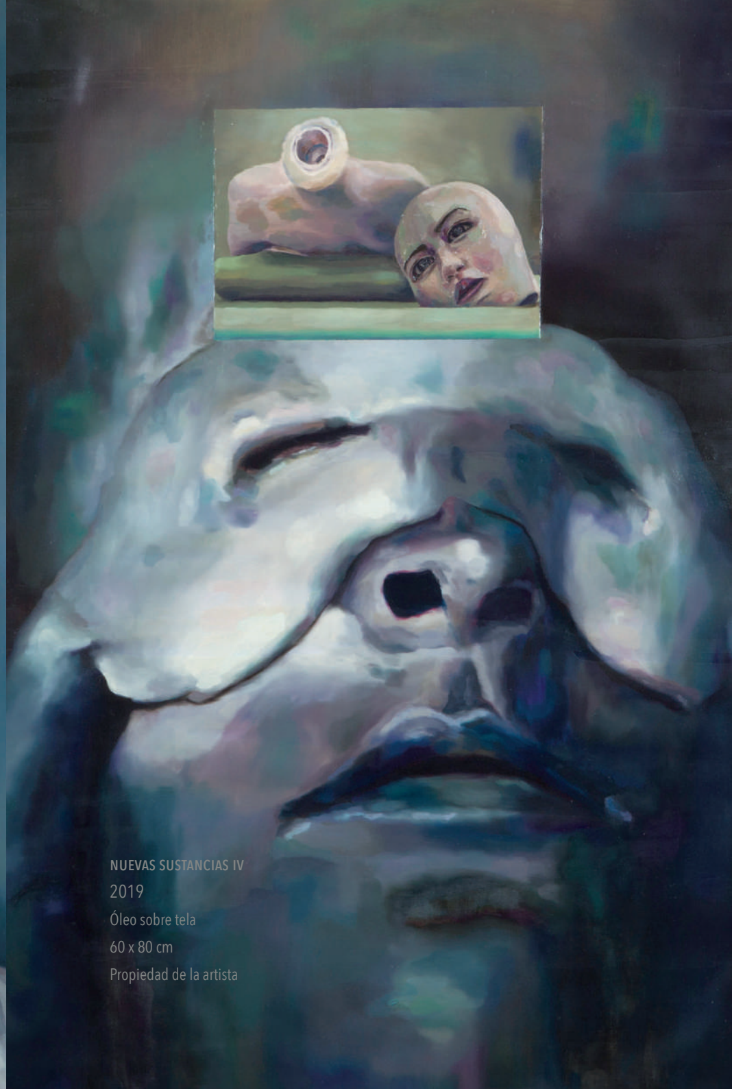
NUEVAS SUSTANCIAS IV 2019 Óleo sobre tela 60 x 80 cm Propiedad de la artista